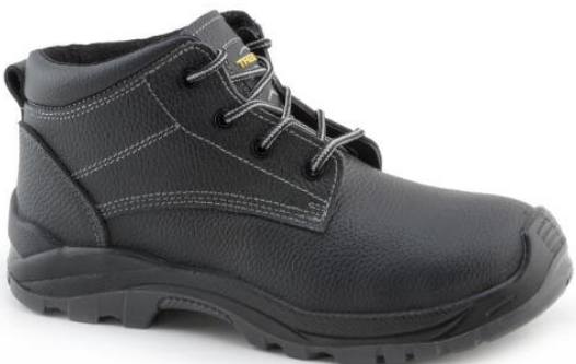
BOTIN ROCKY 927 PU.

•También tenemos la versión BOTIN ROCKY P25 Y P28 PU.