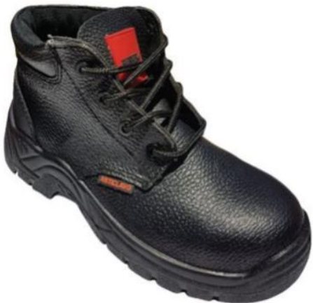
BOTIN SEG NEGRO PU ANTICLAVO.