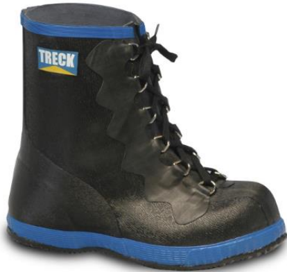
CUBRECALZADO CAUCHO CORTO TRECK.