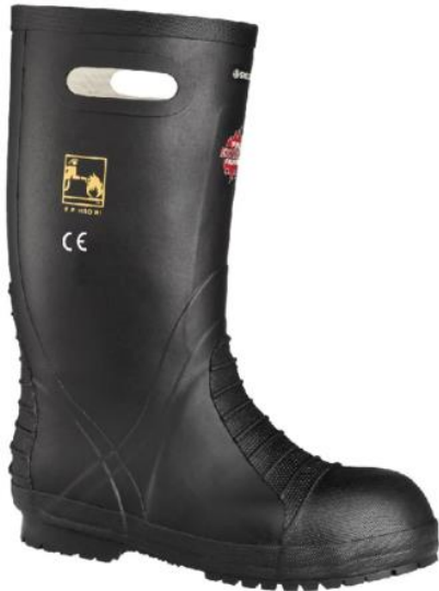
BOTA BOMBERO FIRE EXTREME.