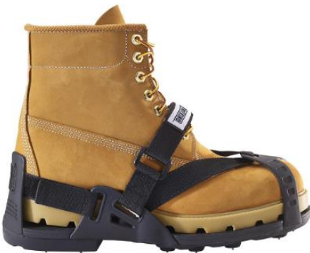
STRAP ANTIDESLIZANTE SERVUS.