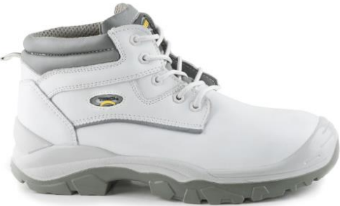
BOTIN RANGER D36 PU.