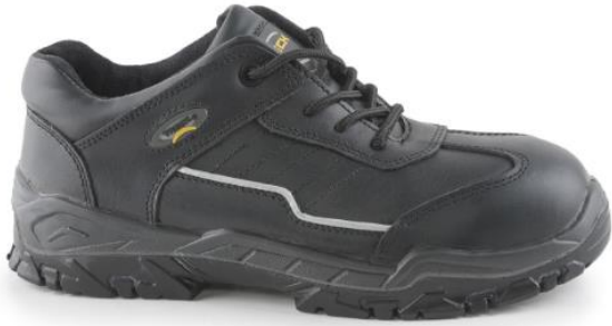
ZAPATO GUARDIAN 960 PU.