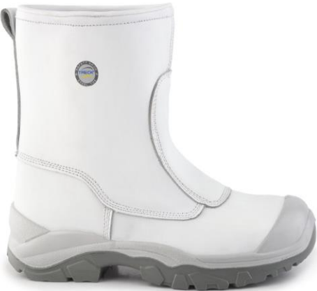
BOTA SILVERADO 451 PU.