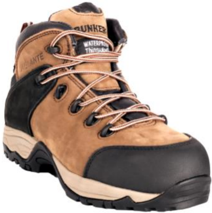
BOTIN BUNKER PLATINO.