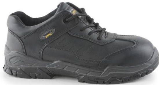
ZAPATO S16 SIN PUNTA.