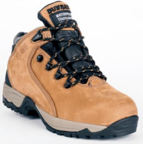
BOTIN BUNKER TITANIO.